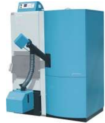
Osnovni delovi Cm Pelet-set-a: